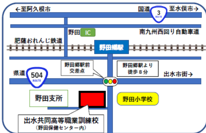
訓練場所：出水共同高等職業訓練校 【駐車場有り】