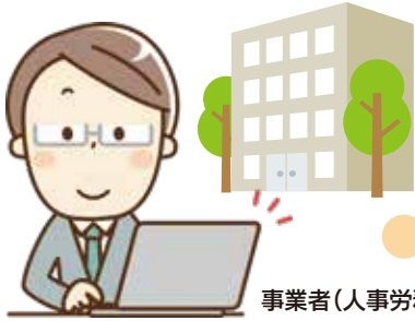
事業者(人事労務担当者)

従業員が病気になりました。 治療をしながら仕事をしたいと相談されましたが、 初めてのことなので、何をしていたらいいかわかりません。 どのような支援を受けられるのでしょうか。