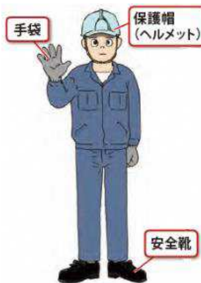
作業者に身につけてほしい望ましい装備例