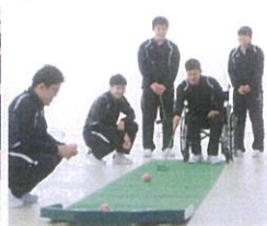
■ レクリエーション実習