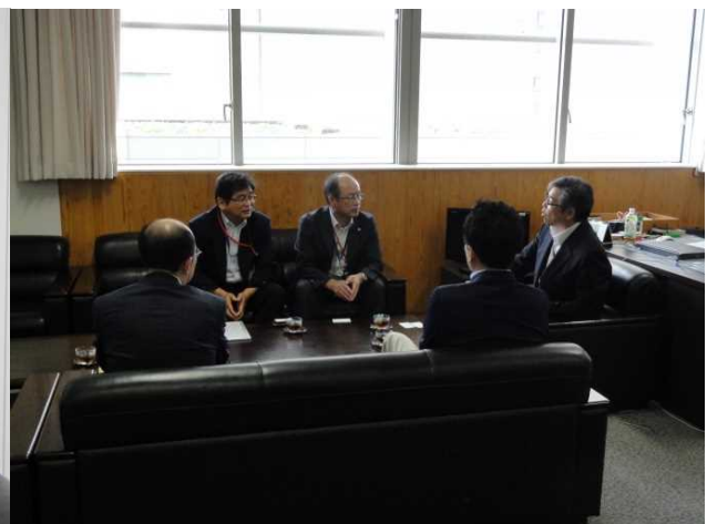
懇談では若者の定着に関する取組などが話されました