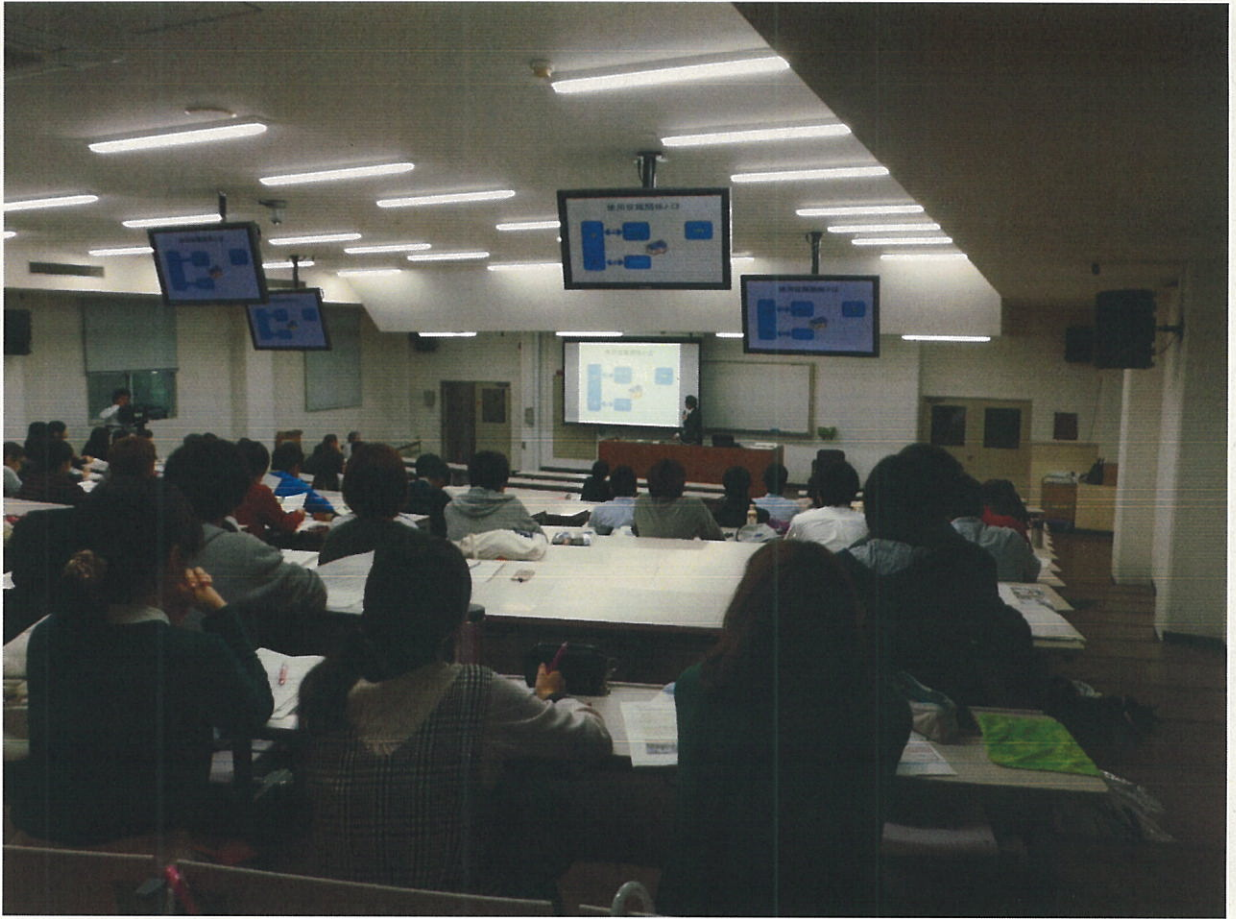
香川大学法学部 J 3 講義室