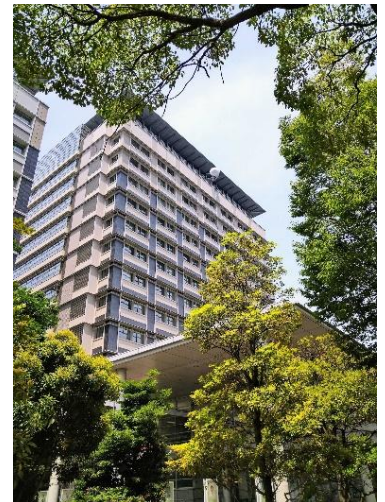
▲香川労働局が入る サンポイト合同庁舎北館

労働基準法等に定める労務管理上の基準が守られるよう、企業に対する指導のほか、労災事故の被災者に対する労災保険の給付（治療等）の事務を行います。（高松、丸亀、坂出、観音寺、東かがわの5カ所）