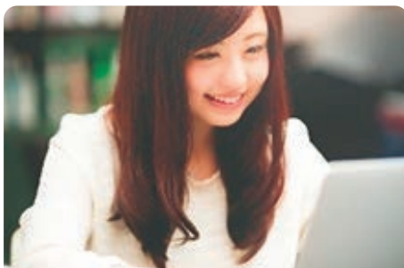
ホームページ作成