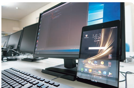
サーバ構築・データベース構築