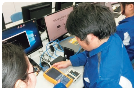
ネットワーク構築