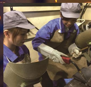
女性も活躍しています