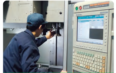
フライス盤/マシニングセンタ