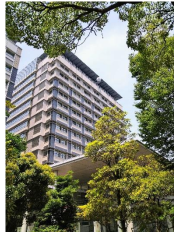
▲香川労働局が入る サンポート合同庁舎北館

労働基準法等に定める労務管理上の基準が守られるよう、企業に対する指導のほか、労災事故の被災者に対する労災保険の給付（治療等）の事務を行います。（高松、丸亀、坂出、観音寺、東かがわの5カ所）