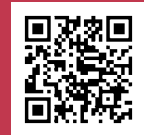
観音寺市で暮らしませんか