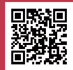
三豊市観光交流局