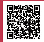
みとよ暮らし手帳