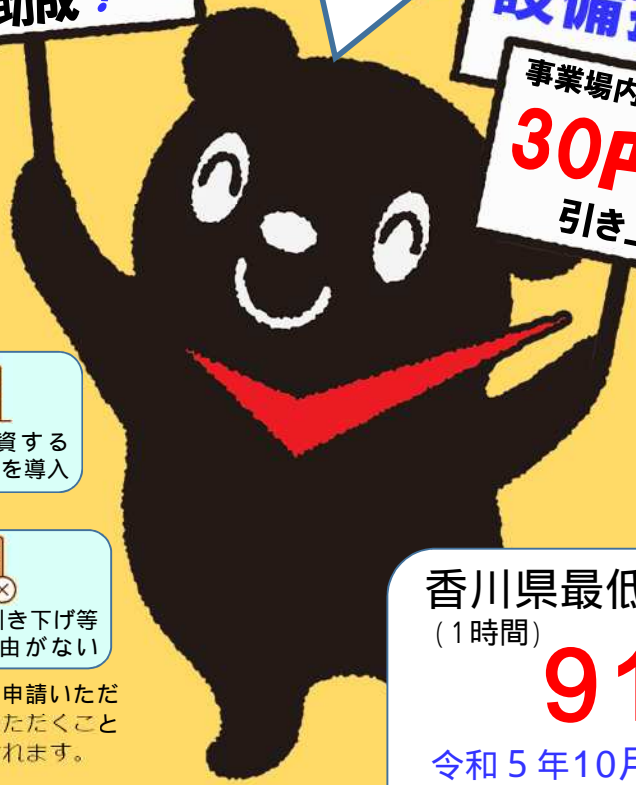
最低賃金制度のマスコット チェックマン