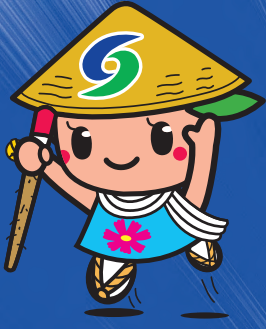
さめき市マスコットキャラクター 「さっきー」