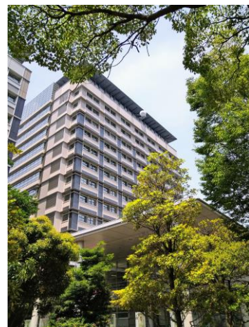
《高松サポート合同庁舎北館》

令和3年度 11名 (①事務官(共通) 10名 ②事務官(基準) 1名) 令和4年度 7名 (①事務官(共通) 7名 ②事務官(基準) 0名) 令和5年度 4名 (①事務官(共通) 1名 ②事務官(基準) 3名)