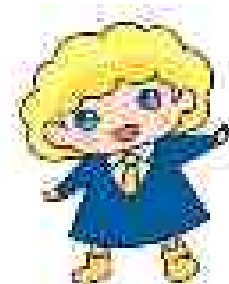
パートタイム・有期雇用労働法キャラクター「パゆちゃん」