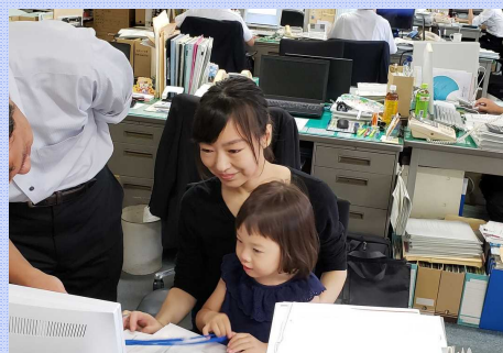
JR 四国本社での職場見学会の様子

今回、当社として 3 度目の認定を受けました。今後も、社員等のワークライフバランスの実現に向けて、仕事と子育ての両立支援のさらなる充実・強化に継続的に取り組むとともに、誰もが「いきいきと活躍できる職場作り」に努めてまいります。