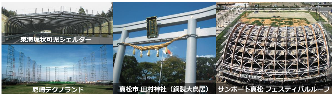
東海環状可児シェルター