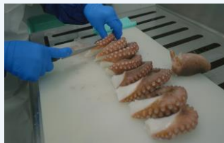
▲作業風景（タコや魚のカットなどを行っています）