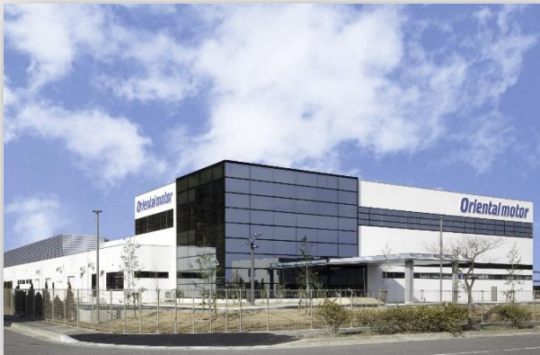
▲高松国分寺事務所外観