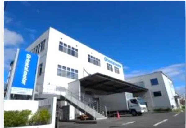
▲高松香西事務所外観

高松で製造された商品の約6割は海外で使用されており、世界の最先端に貢献しています。より良い製品を造り出し、世界中のお客様に提供するという私達の仕事の中にはみなさんが活躍できるフィールドがたくさんあります。「自分を成長させたい」「自分の可能性を広げたい」そんな意欲をお持ちの方はぜひご応募ください。