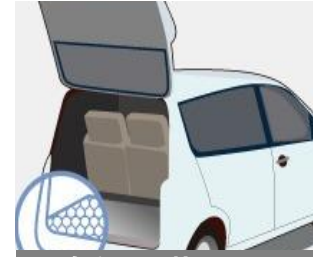
自動車内装パネル