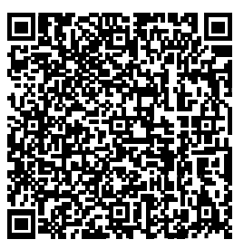
募集中の求人情報 (介護ショップ源内)