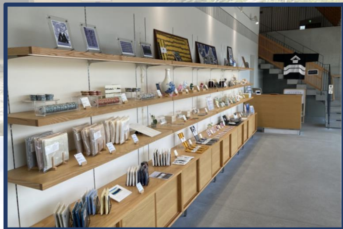
②ミュージアムショップ

お客様に接するお仕事ですので、明るく、楽しく 且つお客様に対して丁寧に接していただける方 をお待ちしています。