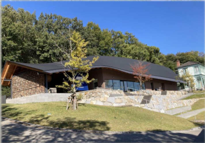
①SHIKOKU MURAミウゼアム“おやねさん”