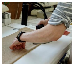
▲ アイロン作業 ▲

当社は“G-STAGE” “GALLIPOLI” “MOVB”など、メンズ服の製造から販売を手掛けるアパレル企業です。オンラインショップをはじめ、有名セレクトショップ、百貨店などでも製品を販売しています。2025年、 東証スタンダード市場上場の株式会社ソトーの傘下 に入りました。 高松工場は、シャツ縫製専門の工場 になります。最大の特徴は、 日本製へのこだわり です。日本製の生地を仕入れ、日本の工場で製造する オールジャパンメイド 。日本製の服製造工場は非常に少なく、その 希少性から高い需要があります 。私たちは、価格を抑えながらも高品質な製品を提供することを使命とし、細部まで丁寧に仕立てることで着る人に満足を届けています。