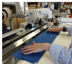
▲ ボタンホール作成 ▲ (自動)