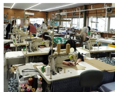
▲ 高松工場の様子 ▲