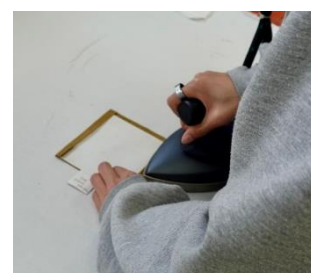
▲ アイロン作業 ▲ (ポケット)