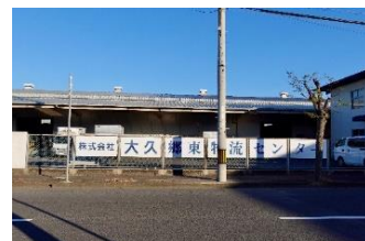
募集中の求人情報