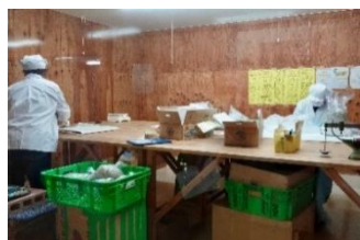
▲選別・袋詰め作業風景

当社は1907年の創業以来、県内の食文化を支える食品流通の担い手として、地域に根ざした事業を展開してきました。 安心・安全で高品質な食品を安定的に届けることで、人々の暮らしと食卓を支えています。 お客様視点の経営も大切にしながら、社員一人ひとりがやりがいをもって働けるような職場づくりにも力を入れています。大久は、アサヒ飲料・味の素・キューピー・日清食品など、 国内有数の食品メーカーとも取引を行っており、食の流通を支える重要な役割を担っています。 これからも「なくてはならない企業」として、地域とともに成長し続けます。