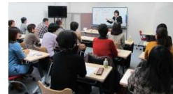
ビジネスマナー セミナー