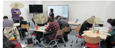
書類作成セミナー

面接は応募者と採用担当者とのコミュニケーションの場。グループワークも立派な面接対策です。