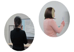
鏡を見ながら 表情確認