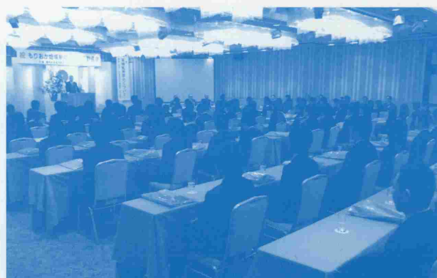
平成22年4月8日に開催した「合同歓迎会」のようす