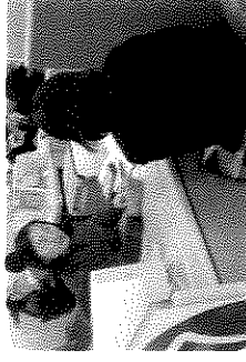
【新卒応援ハローワークで相談】