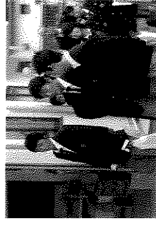
【高校生を企業に引率】