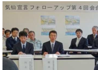
気仙宣言フォローアップ第4回会合

報告書では、1年間の取組の成果と課題を踏まえた「5つの提言」が取りまとめられており、その内容は、岩手労働局長から、宮城・福島・熊本各労働局長あてに送付され、各地の復旧・復興工事での過重労働の解消に役立てられます。