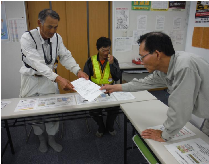
雇用契約書の確認に当たる元請職員（女川町の現場事務所）

予期せぬ低い労働条件で労働することから労働者を保護するため、労働基準法第 15 条では、事業主に対し、賃金、労働時間といった労働条件を労働者に書面交付で明示すること等を義務付けています。