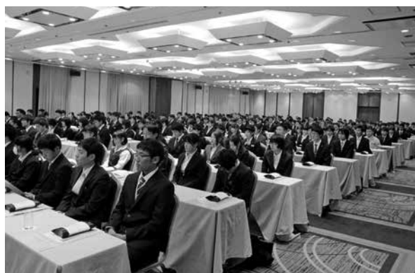
写真は、平成29年度「合同歓迎会」の様子