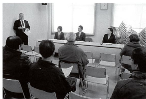
企業説明会&就職ミニ面接会の様子