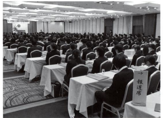
写真は、平成 28 年度「合同歓迎会」の様子