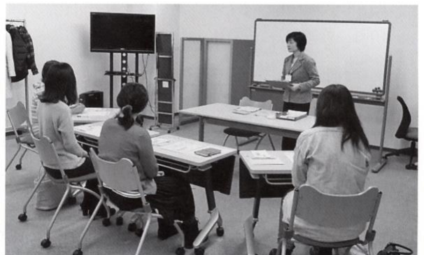
マザーズ面接セミナーの様子

ハローワーク盛岡菜園庁舎のマザーズコーナーでは、1月23日（月）に利用者対象の面接セミナーを実施しました。これは出産等で離職し、子育てを行いながらの求職活動について、保育園の状況や保険関係等の知識の周知と、具体的な選考技量を支援するため行っているものです。当日は荒天の中4名が参加し、お互いの状況についてディスカッションを行うとともに担当者による選考時の具体的な方策について熱心に聞き入っていました。