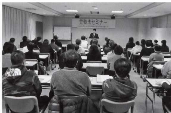
わかもの支援コーナーのセミナーの様子