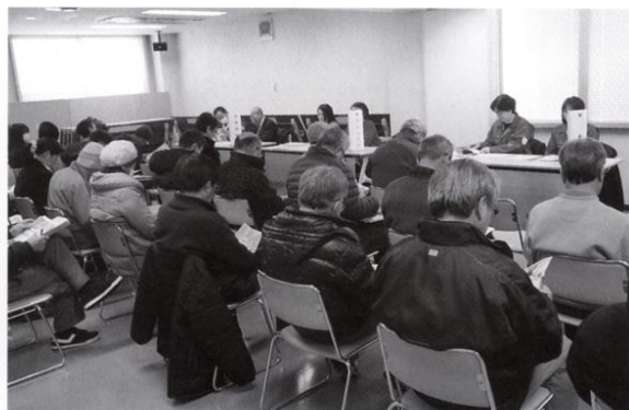
シルバー対象企業説明会&amp;就職ミニ面接会の様子