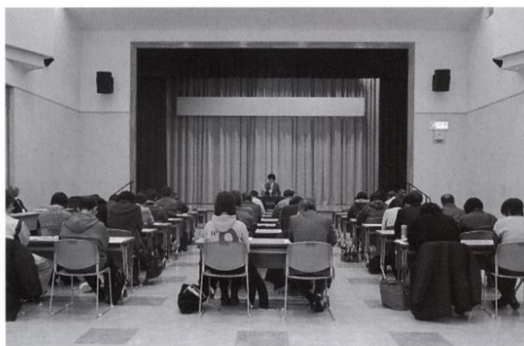
ハローワーク沼宮内のセミナーの様子

ハローワーク盛岡では、盛岡労働基準監督署と連携し、わかもの支援コーナーにおいては1月11日（水）に盛岡大通商店街協同組合「リリオ」にて若年者を対象とした「労働法セミナー」を、ハローワーク沼宮内においては1月17日（火）に岩手広域交流センター「プラザあい」にて雇用保険適用事業所を対象とした「改正雇用保険法説明会&労働基準法基礎セミナー」を開催いたしました。いずれも関連法令の周知並びに知識不足を解消し、業務遂行や求職活動における誤りや不安感を少なくすることを目的として開催したものです。「労働法セミナー」には45名の利用者が、「改正雇用保険法説明会&労働基準法基礎セミナー」には30社34名が参加しました。それぞれの参加者は、労働関連法令の実例を織り交ぜた説明に真剣に聞き入っていました。