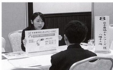
企業説明会のようす