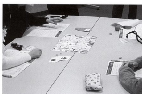
すごろくトーキングのようす