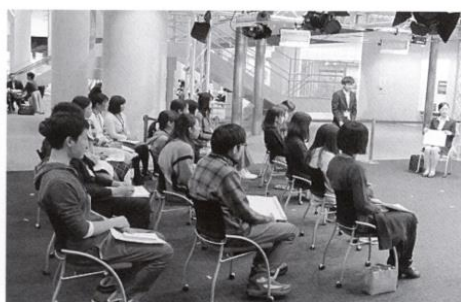
先輩内定者とのスペシャル座談会のようす