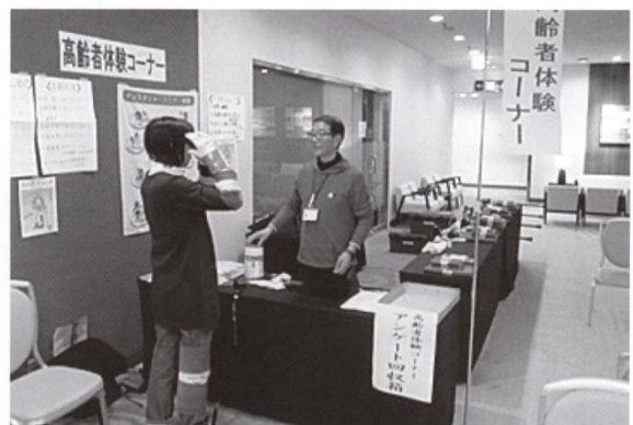
福祉の仕事就職フェアの様子