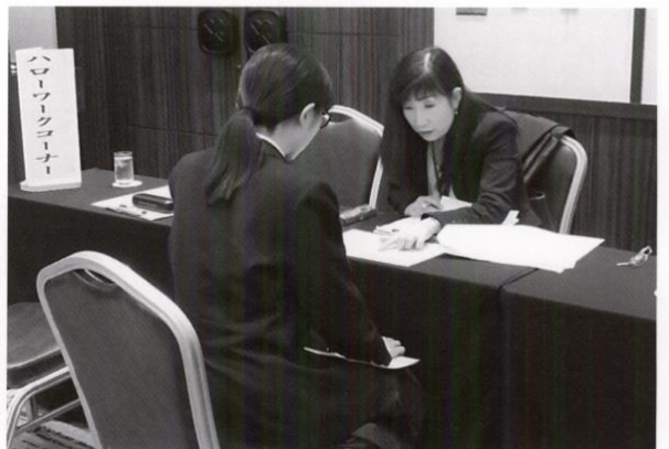
就職面談会のようす