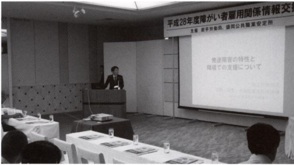
第一部 雇用関係情報交換会

第二部の障がい者就職相談会では、35事業所47名の参加があり、障害者の方も262名の参加がありました。雇用情勢は回復が進み、障害者の就職状況も改善されているものの登録者が高止まり傾向にある中、参加した方々は、各ブースをまわり企業人事担当者の説明を真剣に聞き情報の収集を行っていました。