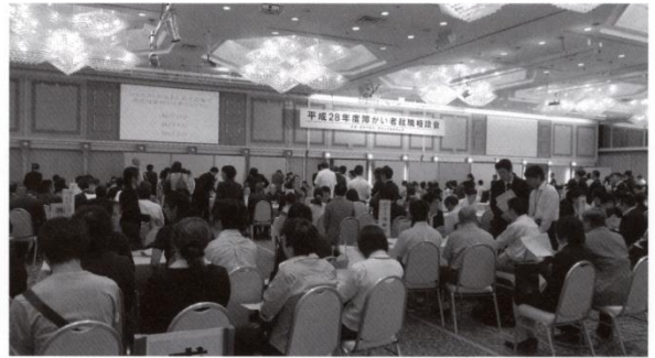
第二部 障がい者就職相談会