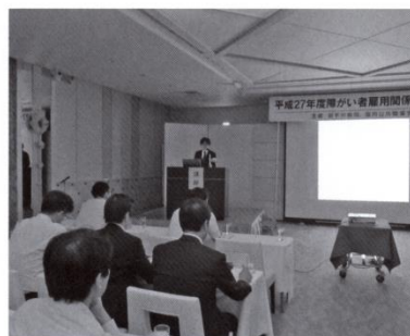
昨年の「雇用関係情報交換会」のようす