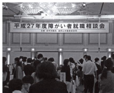
昨年の「就職相談会」のようす

問い合わせ先 ハローワーク盛岡 専門相談部門 障害者担当 (TEL 019-624-8904)