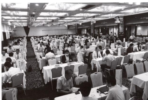
昨年の情報交換会の様子

詳細につきましては、 当所 求人・企画部門学卒担当 019-624-8905 まで お問合せください。