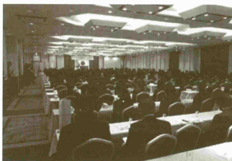
写真は、平成27年度「合同歓迎会」の様子