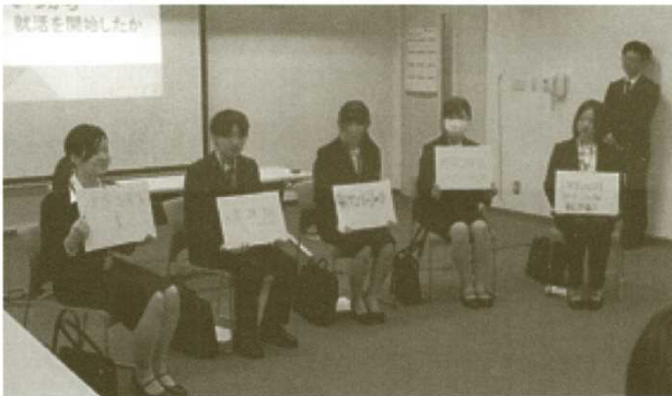
「先輩内定者とのスペシャル座談会」の様子

「先輩内定者とのスペシャル座談会」には6名の先輩内定者と8名の学生が参加し、先輩より自身の就活経験や具体的なエントリーシート提出数、面接数などの就活データや就活スケジュール、ファッション、かばんの中身等実体験について話があった後、学生の参加者よりそれぞれの現時点の疑問点について質問を行う形式で行われ、参加者はリラックスした中にも真剣なやり取りを行っていました。また、「すごろくトーキング」には16名が参加し、ゲームを通じて、サイコロの目に出た設問に対し各々の経験等を周囲に話すために、過去を振り返ることで印象に残っている経験を導き出しその経験と自分との"つながり"である自分らしさを見つけていくことで円滑な就職活動の一助とする経験を行いました。