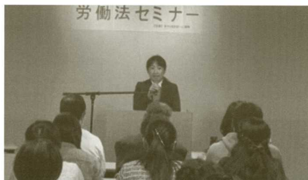
「労働法セミナー」の様子