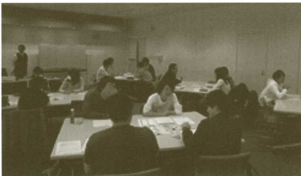
「すごろくトーキング」の様子