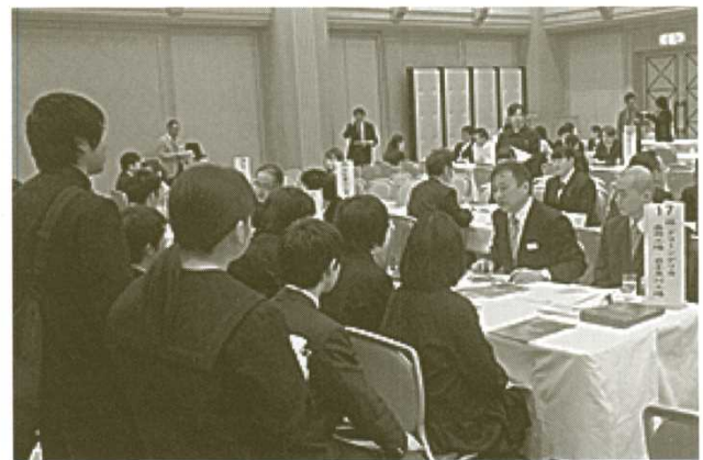
先輩就職者との職業体験交流会のようす