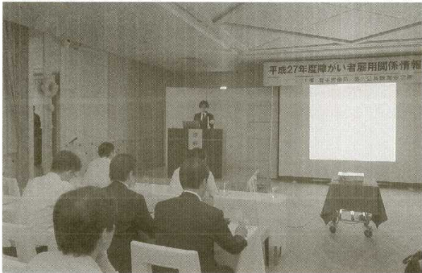
第一部 雇用関係情報交換会

第二部の障がい者就職相談会では、48事業所72名の参加があり、障害者の方も242名の参加がありました。雇用情勢は回復が進み、障害者の就職状況も改善されているもののそれを上回る求職者の増加傾向が見られる中、参加した方々は、各ブースをまわり企業人事担当者の説明を真剣に聞き情報の収集を行っていました。