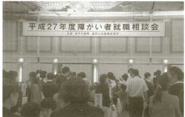
第二部 障がい者就職相談会