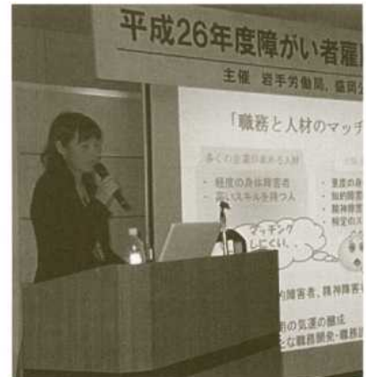
昨年の「就職相談会」のようす

問い合わせ先 当ハローワーク専門相談部門障害者担当 (TEL 019-624-8904)