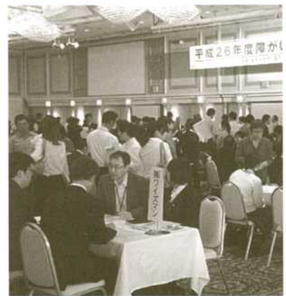
昨年の「雇用関係情報交換会」のようす