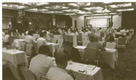
昨年の情報交換会の様子

※ 詳細につきましては、 当所 求人・企画部門学卒担当 （019-624-8905）まで お問合せください。