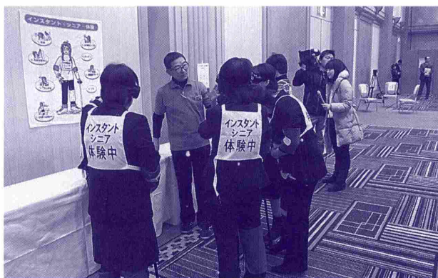
インスタントシニア体験コーナー