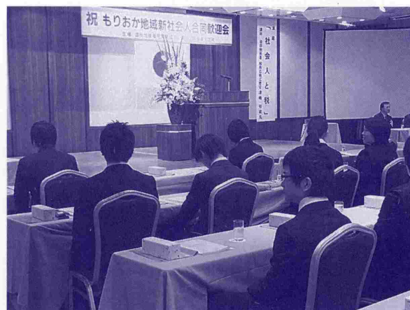
写真は、平成25年度「合同歓迎会」の様子