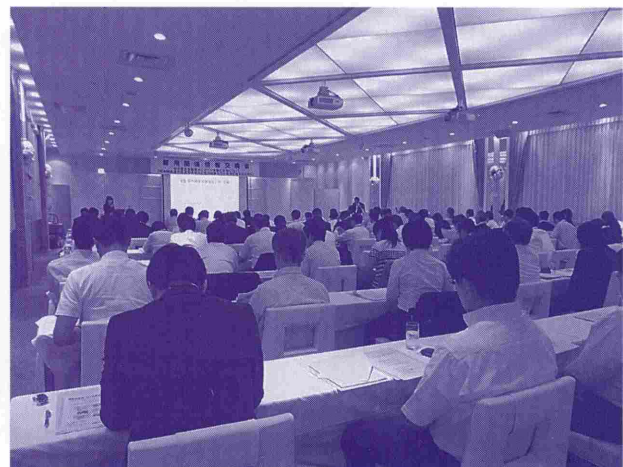
第一部 雇用関係情報交換会

第二部の障がい者就職相談会では、昨年を上回る41事業所の参加があり、障がい者の方も224名の参加がありました。一般の雇用情勢は回復しておりますが、障害者を取り巻く就職状況は依然として厳しい状況が続いている中、参加した方々は、各ブースをまわり企業人事担当者の説明を真剣に聞き情報の収集を行っていました。