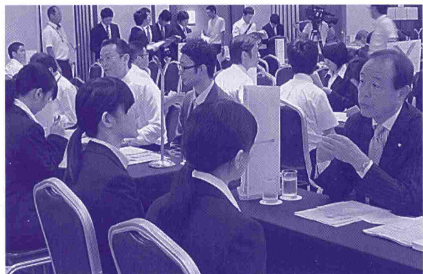
最近の求人求職のうごき