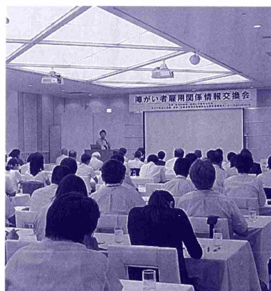
昨年の「雇用関係情報交換会」のようす