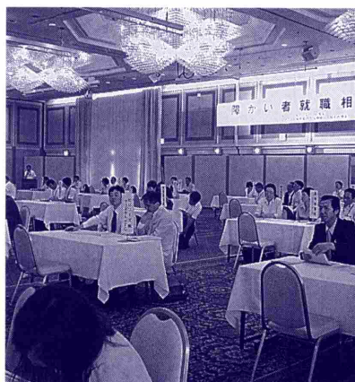
昨年の「就職相談会」のようす

問い合わせ先 当ハローワーク専門相談部門障害者担当 (TEL 019-624-8904)